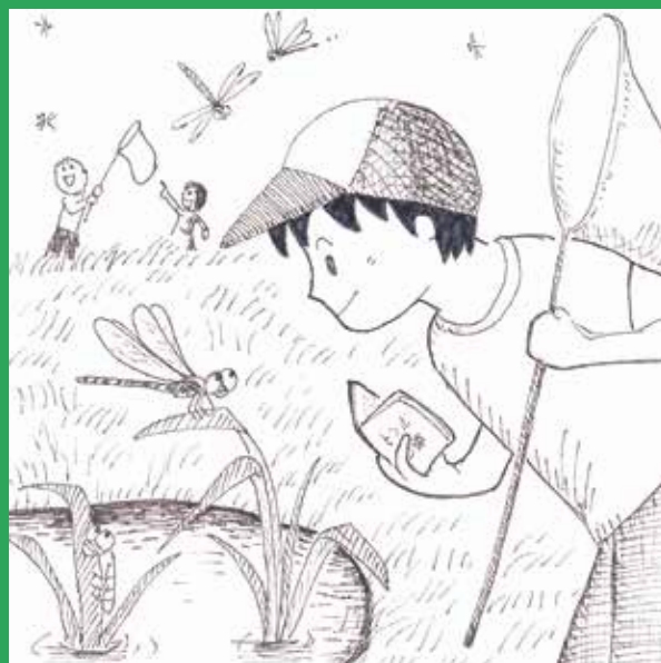
8/9 (土) トンボ