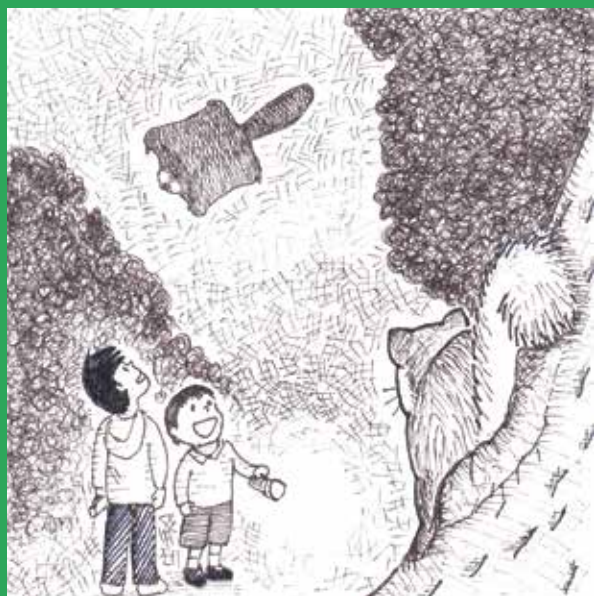
7/12 (土) ムササビ