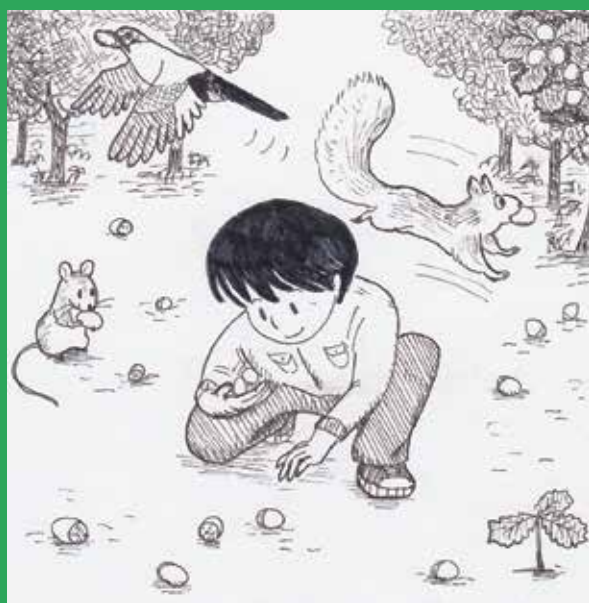
10/11 (土) ドングリ