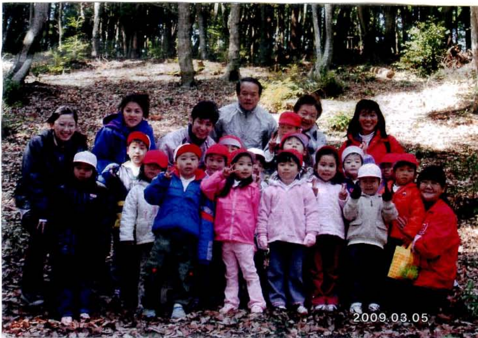
平成21年3月5日 七人谷山(いわけ市) 「あそび幼稚園」(あそび市) 対象